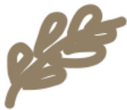
Žemės ūkio produktų gamyba