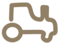
Prekės ir paslaugos žemdirbiams

Grupės veikla yra skirstoma į keturis pagrindinius veiklos segmentus. Skirstymą į atskirus segmentus lemia skirtingos produktų rūšys bei su jais susijusios veiklos pobūdį, tačiau dažnai segmentų veikla yra susijusi tarpusavyje.